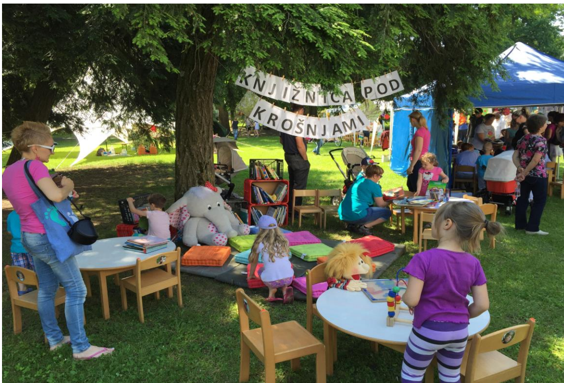
Slika 5: Knjižnica pod krošnjami na družinskem pikniku v mestnem parku, 30. 5. 2015