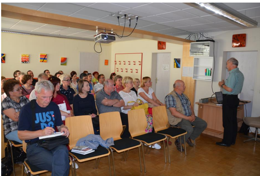
Slika 9: Strokovna ekskurzija z izobraževanjem, 25. 6. 2015