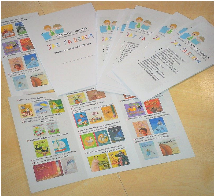
Slika 4: Povabilo k sodelovanju Jaz pa berem