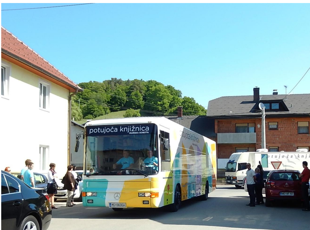
Slika 8: 20 let potujoče knjižnice, Grad, 8. maj 2015

Za kulturni program so poskrbeli učenci OŠ Grad z glasbeno točko in dramatizacijo Zmešnjava v deželi pravljic. Po strokovnem delu pa je sledil ogled razstave ob 20-letnici delovanja potujoče knjižnice v avli OŠ Grad in ogled gradu s strokovnim vodenjem.