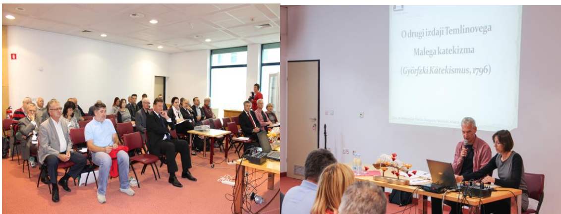
Slika 7: Mednarodni znanstveni simpozij, Pokrajinska in študijska knjižnica Murska Sobota, 8. 10. 2015