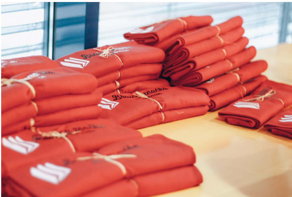
Slika 1: Zaključna prireditev Bralne značke, 3. 6. 2015.