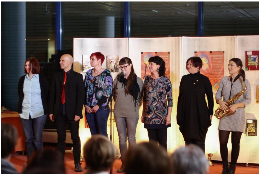
Slika 2: Pravljični večer za odrasle, 1. 12. 2015