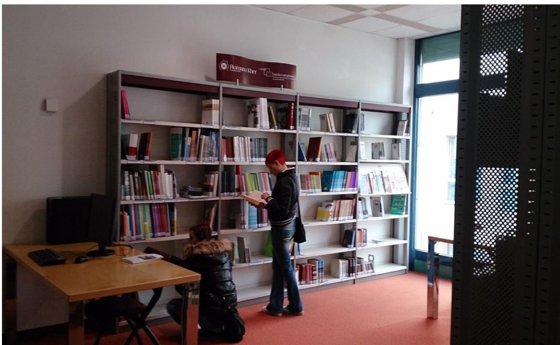
Slika 3: Romski oddelek, marec 2015

Pokrajinska in študijska knjižnica Murska Sobota je od februarja 2015 bogatejša tudi za romski oddelek, na kar smo še posebej ponosni, saj smo edina knjižnica na slovenskem ozemlju, ki se ponaša s tem oddelkom. Romski oddelek, ki se nahaja v prvem nadstropju knjižnice, je rezultat projekta Romano Kher - Romska hiša v sodelovanju z romskim društvom Phuro Kher - Stara hiša ter Pokrajinsko in študijsko knjižnico Murska Sobota. Na voljo je čez sedemsto enot knjižničnega gradiva z romsko tematiko, od knjig, DVD-jev in plošč do časopisov in drugega gradiva, ki je ustrezno obdelano in razporejeno. Ne manjkajo niti leposlovne in strokovne knjige v romskem jeziku avtorjev iz lokalnega in širšega evropskega prostora. Zbiranje gradiva se bo nadaljevalo tudi v prihodnje, saj le-to navsezadnje pomembno vpliva na knjižnično dejavnost kot tudi na spoznavanje romske kulture, jezika, zgodovine in njihove identitete.