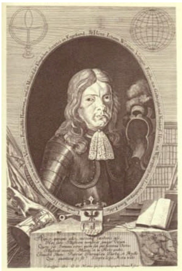
Janez Vajkard Valvazor