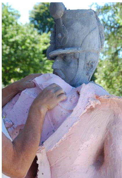
Lekerül az öntőforma - újjászületés

alakot, amiről később levettük a hiányzó részek mintáját. Az utóbbihoz különböző anyagokat használtunk (sziporekszet, habarcsot, agyagot, gyúrmát). Bizonyos részeket nem lehetett kivenni a régi fényképekből, ezért olyan rajzokat és fényképeket kerestük, amelyek a korabeli magyar katonák egyenruháit ábrázolják. Az így megformált figurát használtuk az öntőforma elkészítéséhez. A könnyebb szét- és összeszerelés érdekében az öntőformát öt részből készítettük el, ezeket csavarokkal erősítettük egymáshoz. Ezt követően elkészítettük az anyagot a szobor kiöntéséhez. A keverékhez fehércementet, kalcid homokot, adalékként szürke cementet, valamint színpigmenseket és plasztifikálószeret használtunk. A 185 cm magas szoborhoz kb. 500 kg masszát használtunk fel, amit építészeti cementkeverőben kevertük.