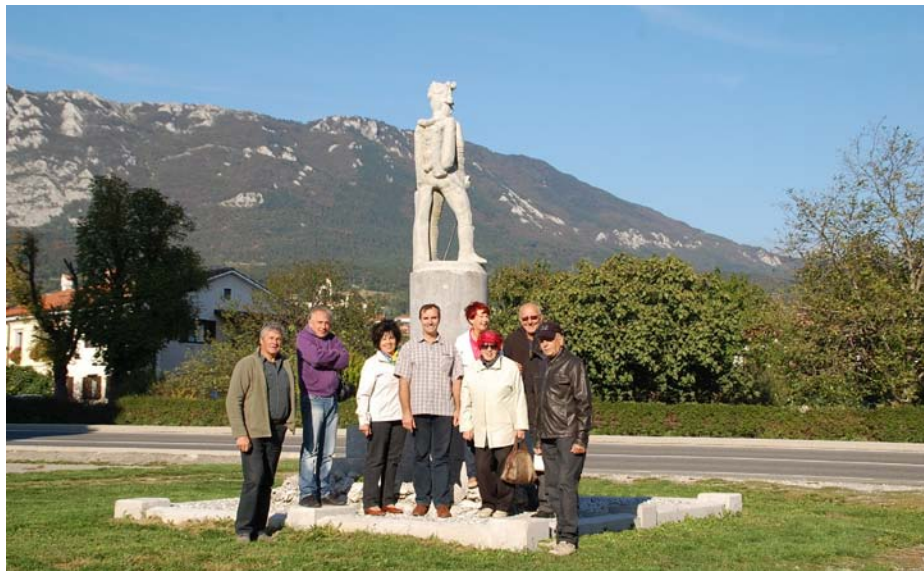
A tanulókör tagjainak találkozója a 200 éves évforduló alkalmából 2013. október 3-án

az egymás iránti bizalom segítségével valósulhatott meg. A tanulókör tagjai egymaguk, a többi közreműködő, az egyesületek, az intézmények és a falubeliek megértése és támogatása nélkül nem tudták volna megvalósítani elképzelésüket.