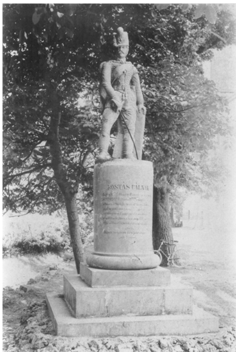
Az eredeti emlékmű

Az emlékmű elhelyezésének munkálatait két katona végezte. Az emlékművet azon a helyen emelték, ahol a hőst eltemették, hattól nyolc öltre a templomtól és három öltre az úttól. Erre az ünnepségre Goricából Ipavába érkezett Lepopld herceg tenger melléki-népi császári gyalogregimentjének két szakasza és azoknak tiszturakból való sok társasága, akik lobogókat és még zenét is hozának magukkal.