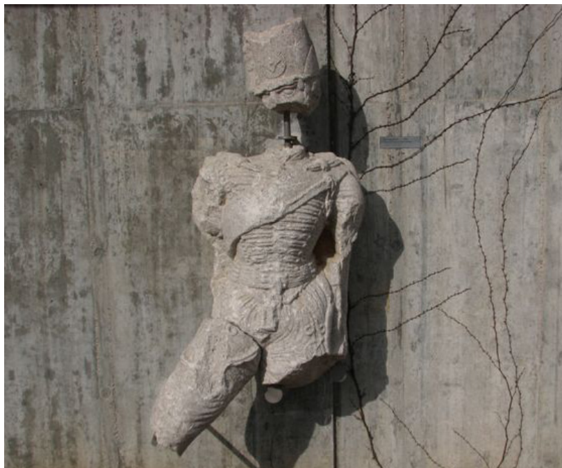
A szobor maradványai

Az olasz hatalmi szerveket az első világháború után zavarta a huszárruhás katona emlékműve, ezért a szobrot eltávolították a talapzatról. Azt sok időre rá Vrpoljeban elásva találták meg igen sértett állapotban. Amikor berendezték a gorcai múzeum lapidáriumát, a szobortest megmaradt részét is elhelyezték benne. Az emlékmű másik része Log pri Vipavában maradt, de a talapzat egymagában nem tanúskodhatott arról, hogy az emlékmű milyen történelmi