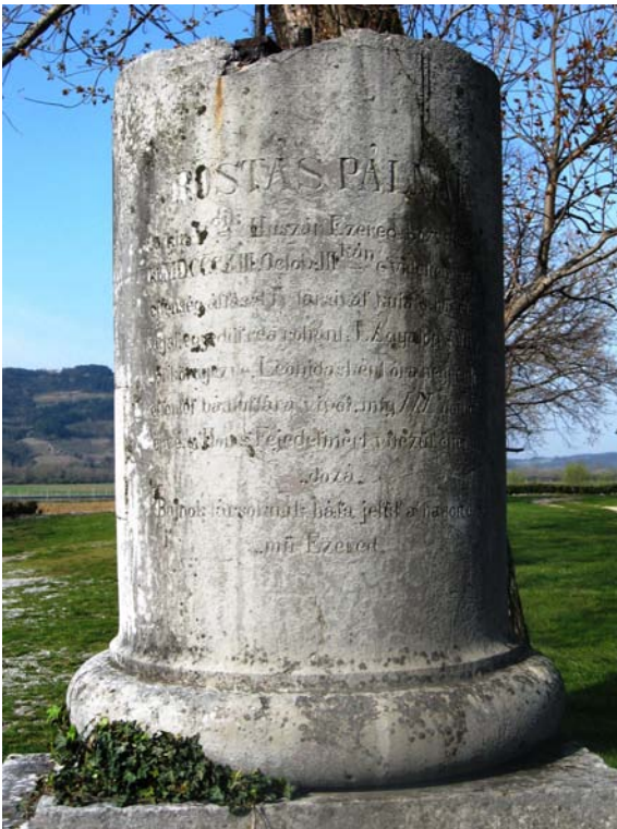
Maradványok a rosszul olvasható felirattal

Az első újságbeszámolót ugyanabban a lapban és ugyanazzal a címmel egy második is követte, éspedig 1845. november 5-én. A cikkből megtudjuk, hogy Matija Vrtovc úr a katonai parancsnok óhajára azt a tisztel feladatot kapta, hogy a templomi ünnepély után az ott megjelent és szlovénul értő tiszteteknek és katonáknak szlovén nyelven beszédet mondjon. Matija Vrtovc felszólalásában megemlékezett 1813. december 3-ról, amikor a fényességes Ferenc osztrák császártól elkobozának bennünket, majdpedig az ő boldogító uralma alá újra visszakerülénk.