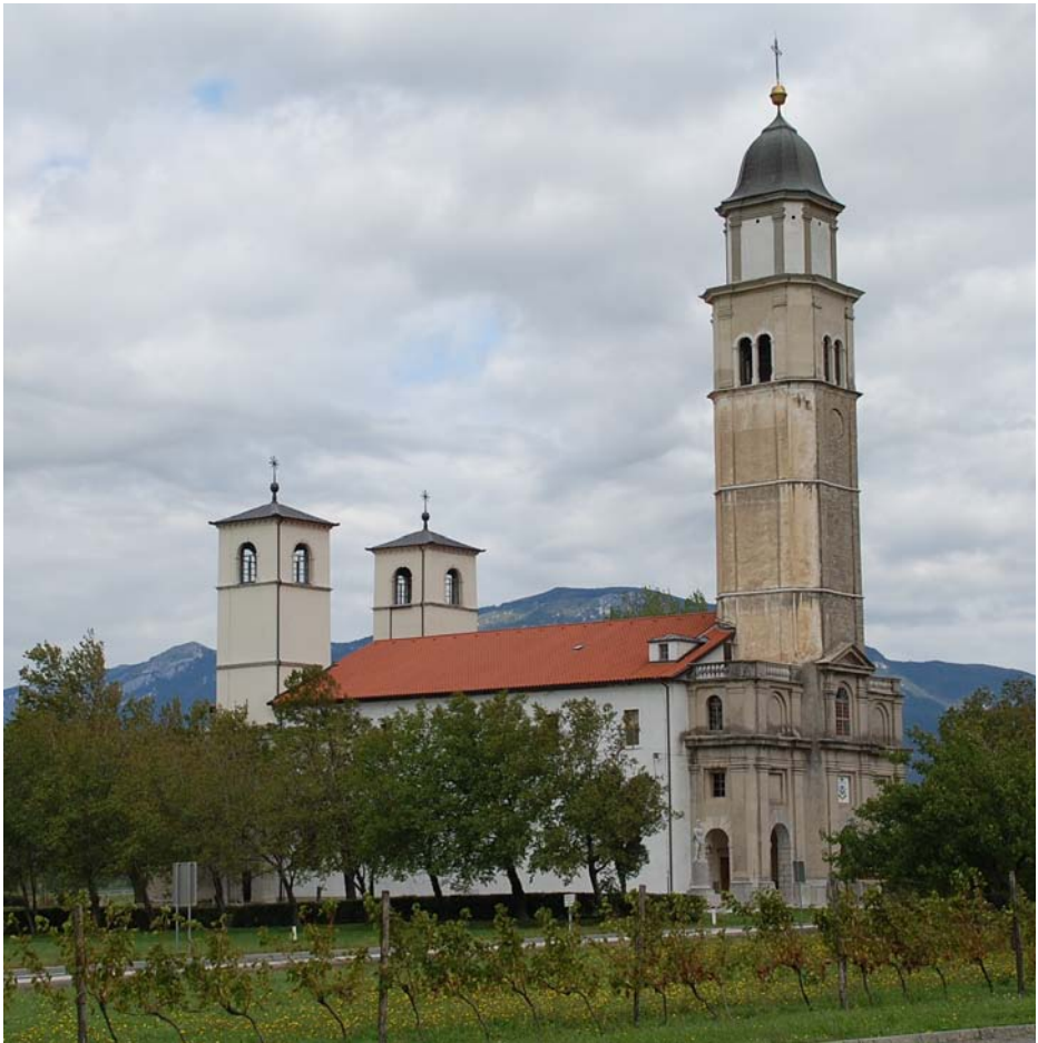
Log pri Vipavi