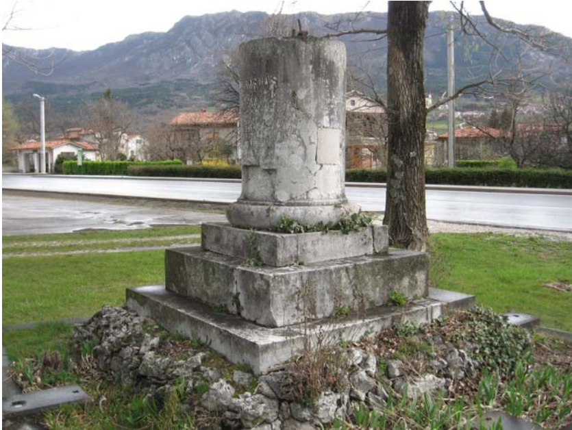
A talapzat maradványai

körülmények között jött létre. Ugyanakkor a járókelők vélhetően már számos alkalommal feltették maguknak a kérdést a különös emlékműmaradvány szerepéről és rendeltetéséről.