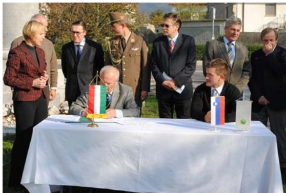
A háromoldalú szerződés aláírása

Nem hagyhatjuk említés nélkül, hogy az emlékmű felújítása kapcsán a tenni vágyó egyéneknek és szakembereknek egy kiváló csoportja verődött