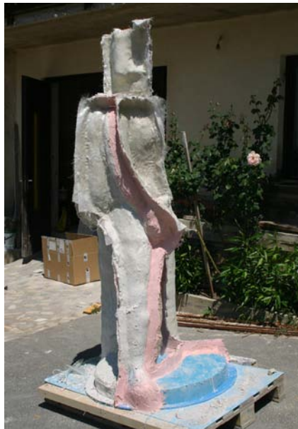
Az öntőforma elkészítése