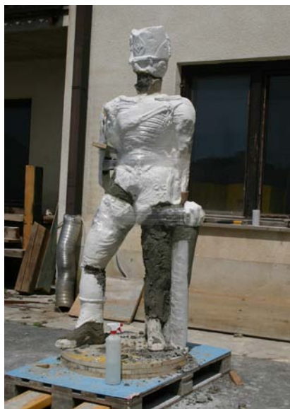
A szobor megformázása