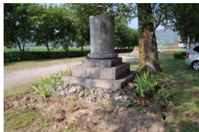
Megkezdődik a felújítás

A kőtálcán és a henger alakú talapzaton már 2010-ben restaurációs beavatkozásokat végeztünk. A kő részeket mindenekelőtt megtisztítottuk a szennyeződéstől és a lerakódott algáktól. A munkálatot mikro-homoksugarazással végeztük. Hogy a bevésített ajánlást (északi oldalon magyar, déli oldalon pedig német nyelven) meg ne sértsük nagyon alacsony nyomást alkalmaztunk. Munkánkat azzal folytattuk, hogy a talapzat egyes kőrészeit leszereltük és a restaurációs műhelybe szállítottuk őket. A megrepedt részeket