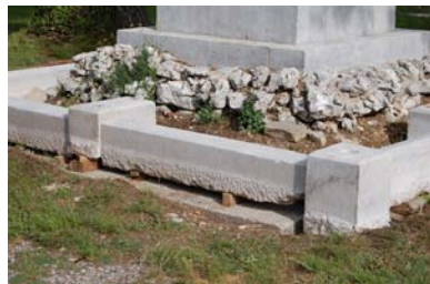
Készülnek az alapok